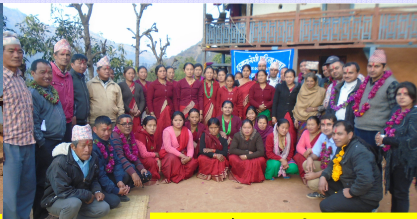
अनुगमन टोलीसंगै ढुङानावंशी महिला समूहका सदस्यहरु