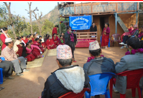
अनुगमन टोलीसंग अन्तक्रियामा समूहक