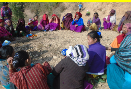
गल्धामा महिला समूहको बैठक बस्दै

इन्द्रेणी समाज केन्द्र नेपालद्वारा अन्तर्राष्ट्रिय विकासका लागि अमेरिकी सहयोग नियोग (USAID) साथ साथ प्रोजेक्टको आर्थिक तथा प्राविधिक सहयोगमा संचालित एचआईभी, यौन रोग रोकथाम, हेरचाह तथा उपचार कार्यक्रम पालुडमैनादी डिआईसीमा अतिरिक्त क्रियाकलाप अन्तर्गत मोजा बुन्ने तालिम सम्पन्न गरियो । २० जना आप्रवासी कामदारका श्रीमतीहरुको सक्रिय सहभागीतामा उक्त कार्यक्रम सम्पन्न भएको थियो । कार्यक्रम सहभागीहरुलाई साथ-साथ प्राजेक्ट मार्फत संचालित कार्यक्रम तथा उपलब्ध सेवाहरुको बारेमा जानकारी गराउने, यौनरोग, एचआईभी, कण्डमको सहि र नियमित प्रयोगको बारेमा जानकारी तथा शिक्षा दिने तथा सहभागीहरु बिचमा कण्डमको सहि प्रयोगका बारेमा जानकारी पुऱ्याउने साथै जाँचका लागि सेवा केन्द्रबारे जानकारी गराउने उद्देश्यले संचालन गरिएको थियो ।