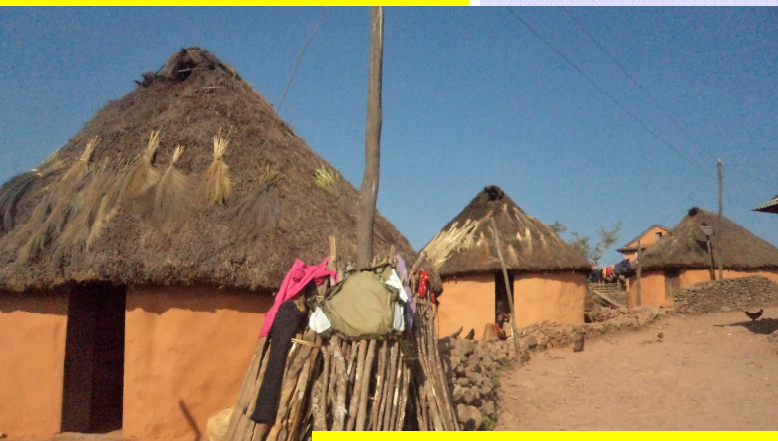
लोप हुदै भिरुवासका कुँडले घरहरु